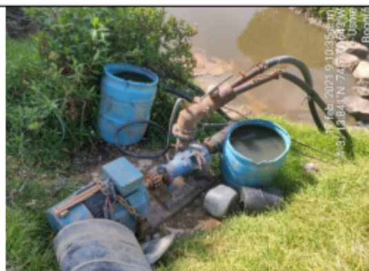
Foto No. 2. Equipo de captación RH río Tunjuelo – coordenadas próximas 4°31'13.695"N 74°7'31.541"W