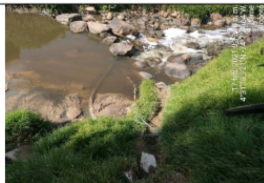
Foto No. 4. Sistema de aspiración (manguera de aprox. 20 cm de diámetro conectada a la electrobomba)