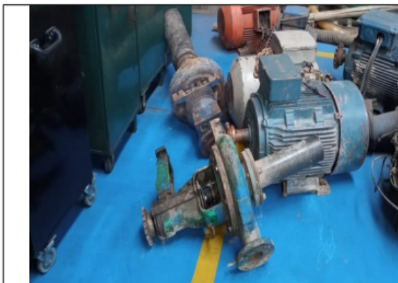
Foto No. 9. Descargue de la electrobomba decomisada en bodega de la Secretaría Distrital de Ambiente.