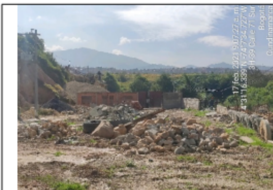
Foto No. 1. Ingreso al CER margen derecho del río Tunjuelo, parte de los predios objetos de control.