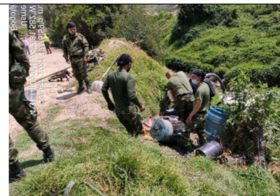
Foto No. 7. Desacople de la electrobomba ubicada en las coordenadas 4°31'13.695"N 74°7'31.541"W.