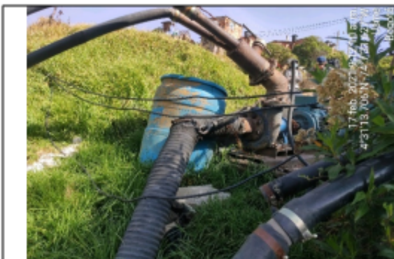
Foto No. 3. Equipo de captación RH río Tunjuelo – coordenadas próximas 4°31'13.695"N 74°7'31.541"W