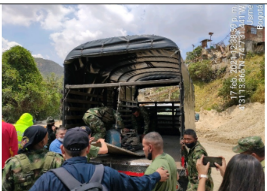
Foto No. 8. Decomiso de la electrobomba ubicada en las coordenadas 4°31'13.695"N 74°7'31.541"W.