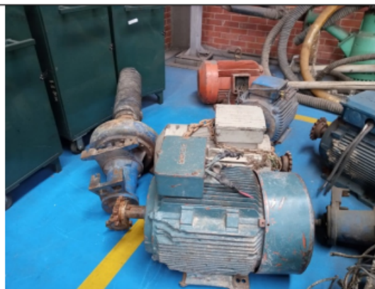
Foto No. 10. Descargue de la electrobomba decomisada en bodega de la Secretaría Distrital de Ambiente.